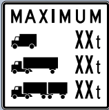
Limitation de poids