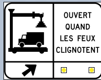
Poste de contrôle du transport routier