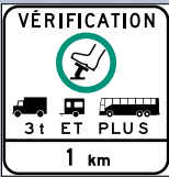
Vérification des freins