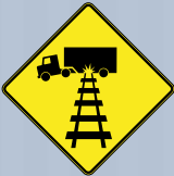
Signal avancé d'un passage à niveau surélevé