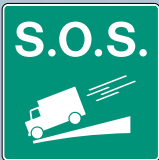
S.O.S. pente raide