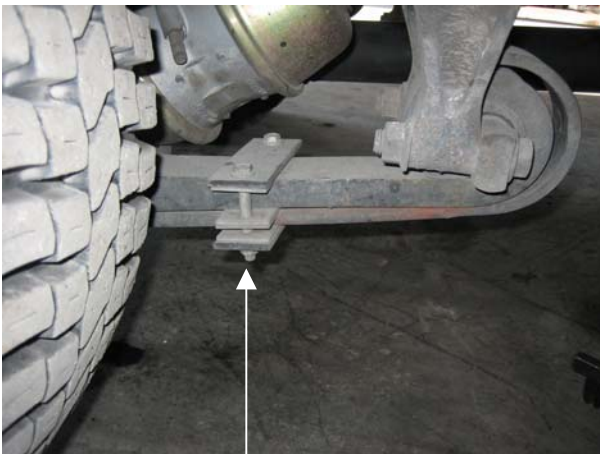
Illustration 1 - Installation non conforme à la norme du fabricant parce que la distance excède 25 mm de l'œil du ressort.

Cette modification étant effectuée par le fabricant, l'ensemble doit être installé selon les normes spécifiées par celui-ci. À défaut de respecter la mesure de 25 mm (1 pouce) entre l'œil du ressort et le système d'élimination de la vibration (schéma d'installation, voir illustration 2), une défectuosité mineure sera appliquée en vertu de l'article 115, par. 1, du Règlement sur les normes de sécurité des véhicules routiers .